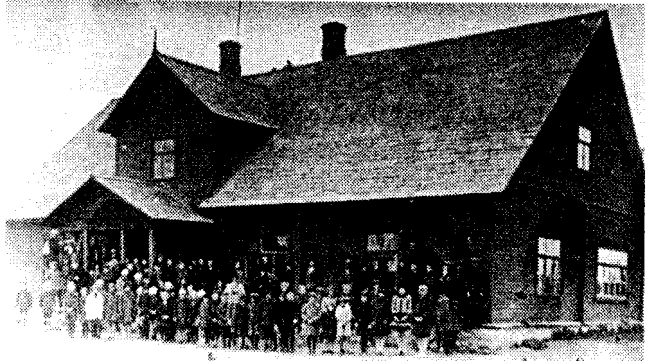
Haljala kool aastal 1920.