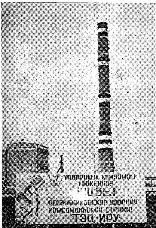
● Vaade soojuselektrijaamale «Iru».

Üks peamisi ehitusi Tallinnas kümnendal viisaastakul Iru Soojuselektrijaam töötab. See on hea kingitus NSV Liidu uue konstitutsiooni aastapäevaks. Eksploatatsioon on antud esimene viiest kompleksist koos kahe veesoojenduskatlagaga, mille üldvõimsus on 200 gigakalorit, ning 7700 meetrit magistraal-soojusvõrku. Soojuselektrijaam «Iru» on esmajoones vajalik selleks, et veelgi ulatuslikumalt