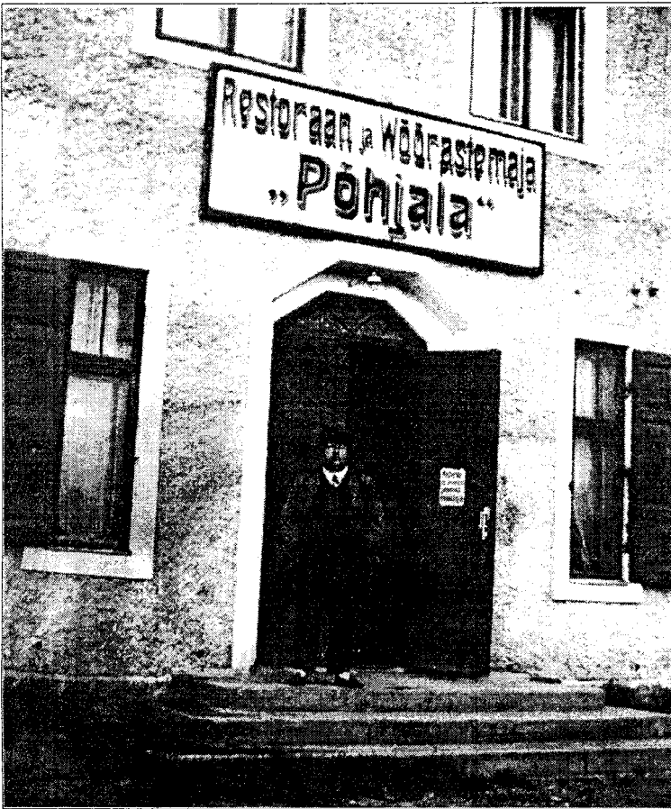
Kunda restoran ja võõrastemaja „Põhjala“ (1937).

andmeil oli Kundas 110 elamut (550 korterit), neist 70 elamut (425 korterit) kuulus vabrikule. Kunda elanike arv oli siis 2310.