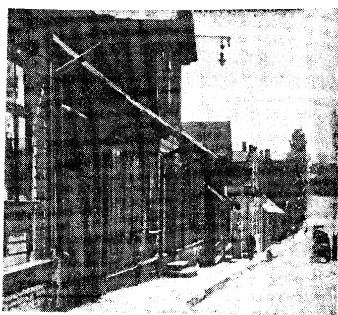
Kool asus kunagi ka endise Pika, nüüdse Kalsnini tänava majas nr. 29, E. Kapstase fotod