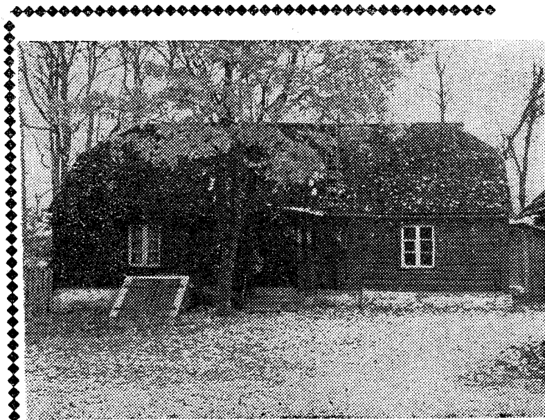
Selles majas (endises Mürriku mõisas) toimusid Väike-Maarja Reaalgümnaasiumi kommunistli ke noorte koosolekud.