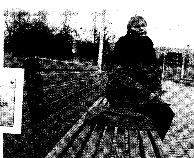
4 X MIELIS MEIL BAUM

Ellen Niit ja Ilmar Talve omavad meie kultuuriloos väga olulist kohta.