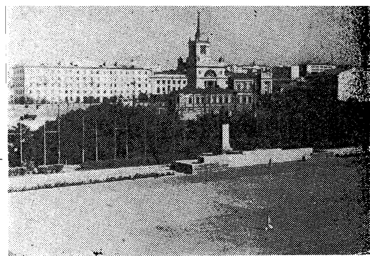
Vaade Lanngenud Kangelaste väljakule Volgogradis.

Kui ilusad on bulvaarid, teed ja alleed, mis meid kohale viivad. Missugune puhtus, lillederohkus, hoonete suursuguselt lihtne joon. Olemegi hotellis. See mahutab