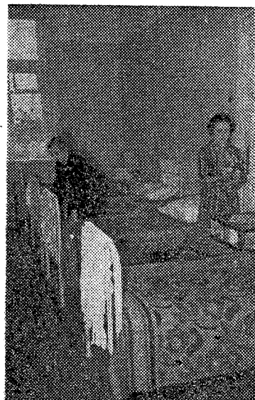
Pildil: ühes Rakvere Kool-internaadi tütarlastetubadest.

Nii nagu teistegi koolide õpilaste, on ka kool-internaatide kasvandike peamine ülesanne hästi õppida ja omandada püsivaid ja kindlaid teadmisi, kultuurse käitumise harjumusi ja armastust tootva töö vastu. Esimestel nädalatel oli mahajääjaid üsna rohkesti. Paljud õpilased olid eelmise klassikursuse omandanud puudulikult või jõudnud varemõpitu unustada. Oli ka neid, kes ei olnud harjunud uute töötingimuste ja -stiiliga. Seda-mööda aga, kuidas lapsed harjusid oma uue koduga, said lahti vanadest harjumustest ja kohanesid uue töösüsteemiga, kahanesid ka puudulikud hinded. Kuigi ka veerandi lõpuks jäi neid, kes ei suutnud joonduda üldise riviga, lõpetab rõhuv enamik esimese õppeveerandi ilma puudujärgita. Kõigi eelduste kohaselt ka suurem osa