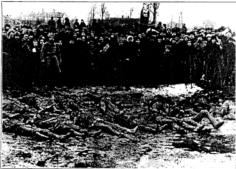
Mõrvaohvrid teisest ühishauast.