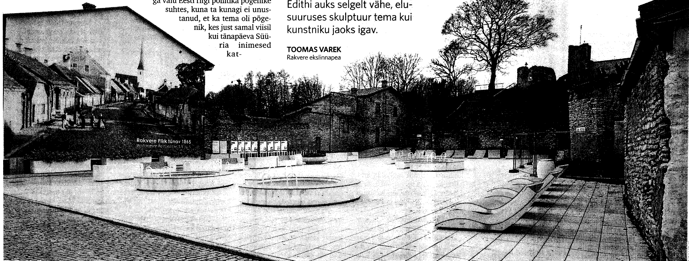
Edith Kotka-Nyman mälestuseks luuakse skulptuuriansambel Rakveres aadressil Pikk 22 asuvale väljakule.

“Traditsiooniline pink on Edithi auks selgelt vähe, elu suuruses skulptuur tema kui kunst-