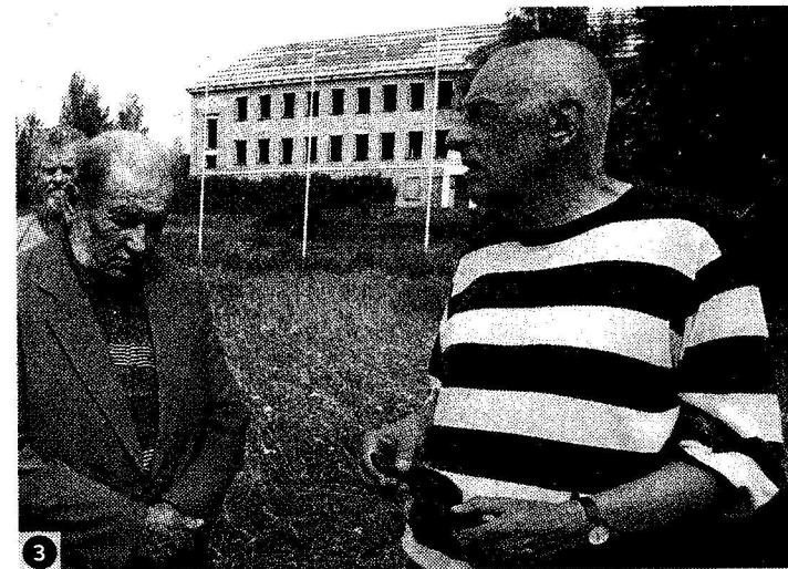
1. Vanade aegade meenutamiseks asetati Vaeküla hariduskivi juurde lillepärj. 2. Need, kes pikka aega näinud ei olnud, vahetasid kontakte. 3. Vaeküla tehnikumi on lõpetanud ka kirjanik Mats Traat (paremal).