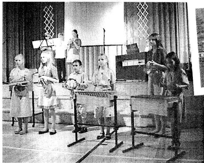
Lehtse koolis oli pidupäev. Tähistati piirkonnas hariduse andmise aastapäeva.

Kuna väga paljudel inimestel on mälestusi Pruuna mõisast, otustatigi sealne ligi sajandipikune kooli lugu kaante vahele panna.