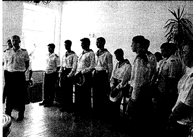
Krusensterni laevameeskonna liikmed, kellest suurem osa merekooli kadetid, külastasid Kiltsi mõisa.