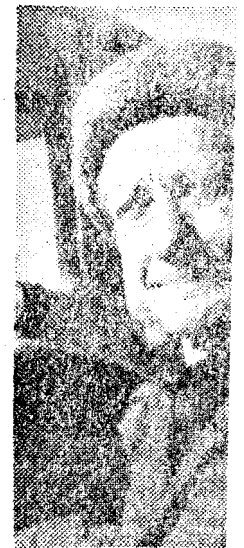
Kui jutuks tulevad