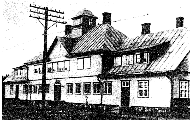
● Kadrina seltsimaja