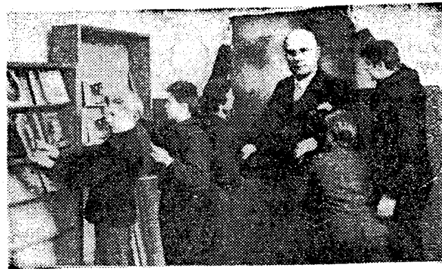
Eduard Vilde 100. sünni-aastapäevaks valmistuti agaralt rajooni asutustes ja koolides.

Ülal pildil näeme Muuga 8-kl. Kooli õpilasi Vilde tuba sisustamas.