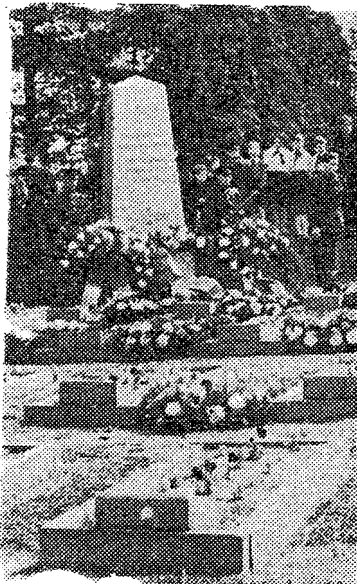
Pilt nr. 1

«... Kõigepealt mõne sõnaga ma räägin endast. Olen