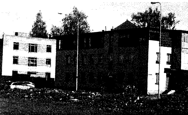
Sõjaväelinnaku hoonetest on saanud korterimajad.