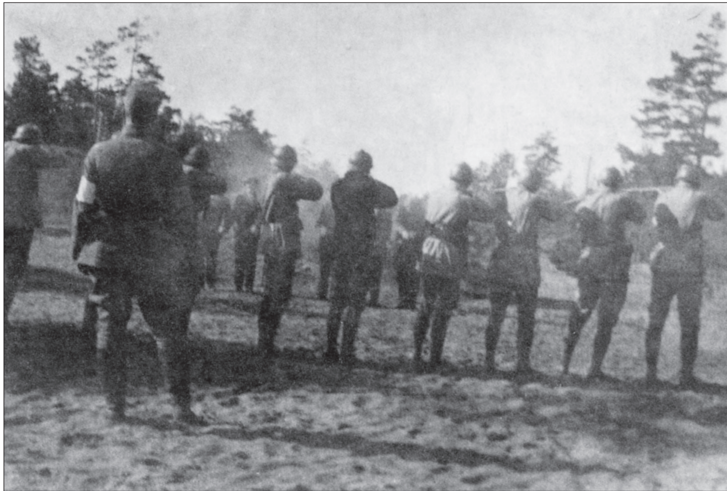
See pilt peaks kujutama Jüri Vilmsi ja tema kaaslaste hukkamist Töölös, kuid tegelikult ei ole pildil oleval hukkamisel Vilmsiga midagi pistmist. Seda pilti lihtsalt kasutati "ametliku" versiooni konstrueerimiseks.

Et sakslased olid okupeerinud nii Eesti kui ka Läti, otsustati minna üle jää Soome kaudu. Käsmu rannast said Vilms,