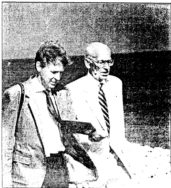
VAADE MERELE: suursaadik ja president jalutasid saarel ning vestlesid ilusast ilmast ja poliitikast.