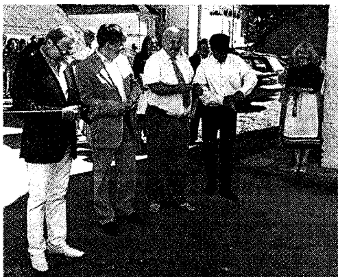
Lindilõikamisel osales ka regionaalminister.